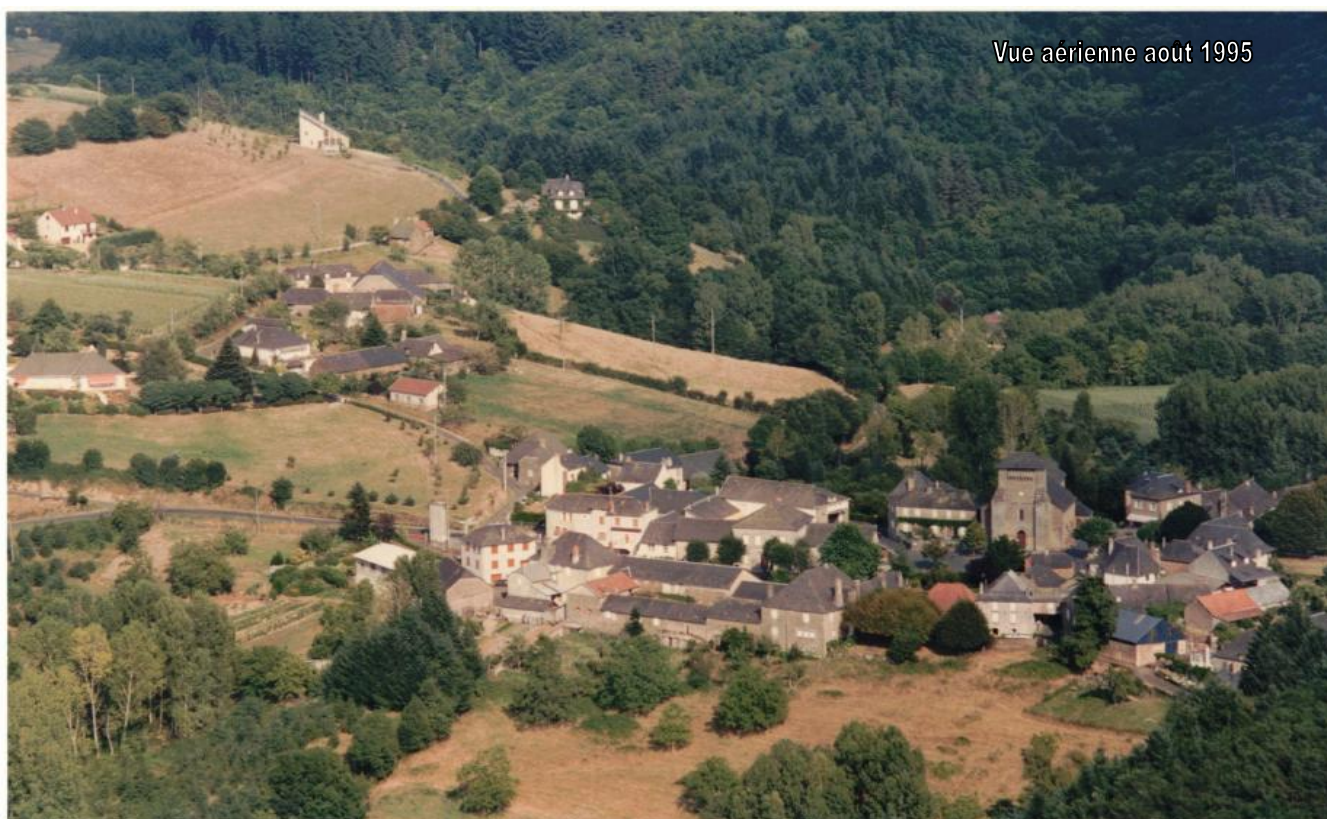
Vue aérienne août 1995