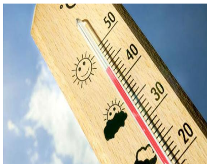
Dampniat, année 2020, semaine 32 Près de 40° à l'ombre, canicule...