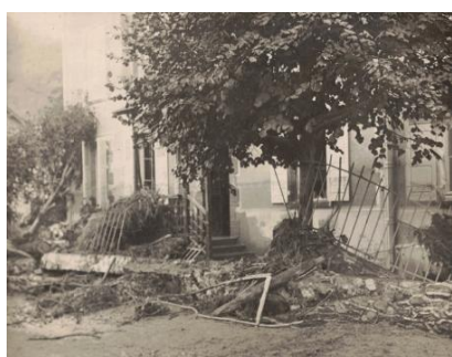
Confolens, maison des contremaîtres Inondation de 1960