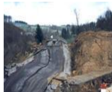
RN 121 près de la Soleille, 1995 Effondrement de la route sur 200m