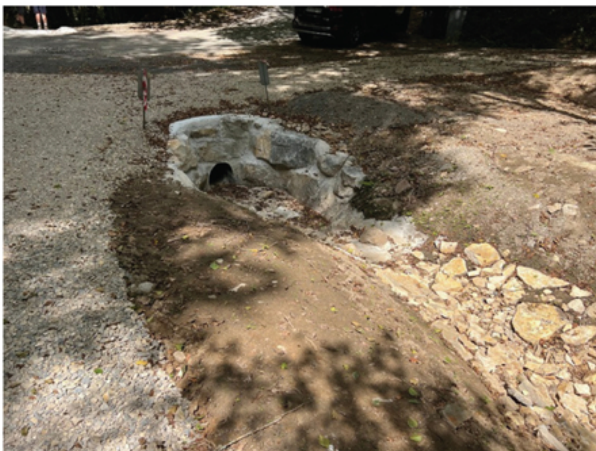
Aménagement eaux pluviales route de Roanne