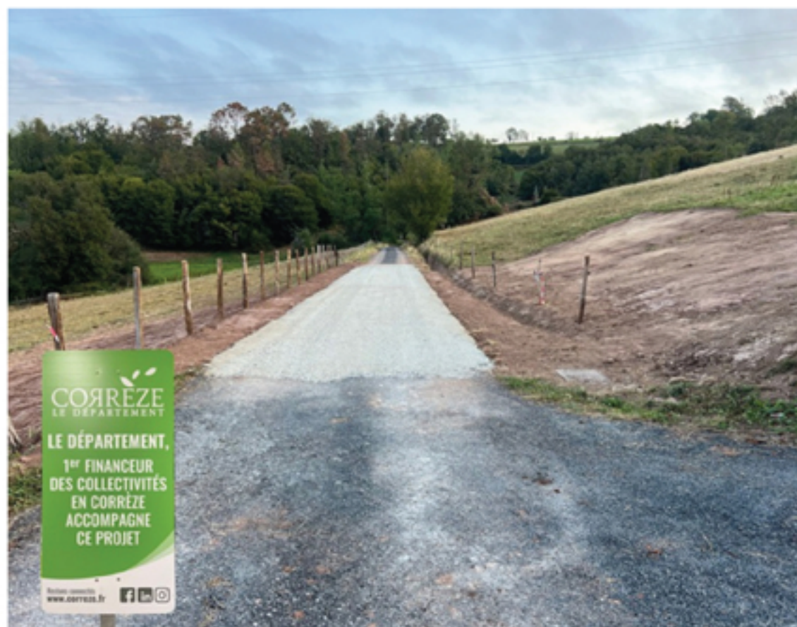
Réfection et consolidation de la route de Taurisson