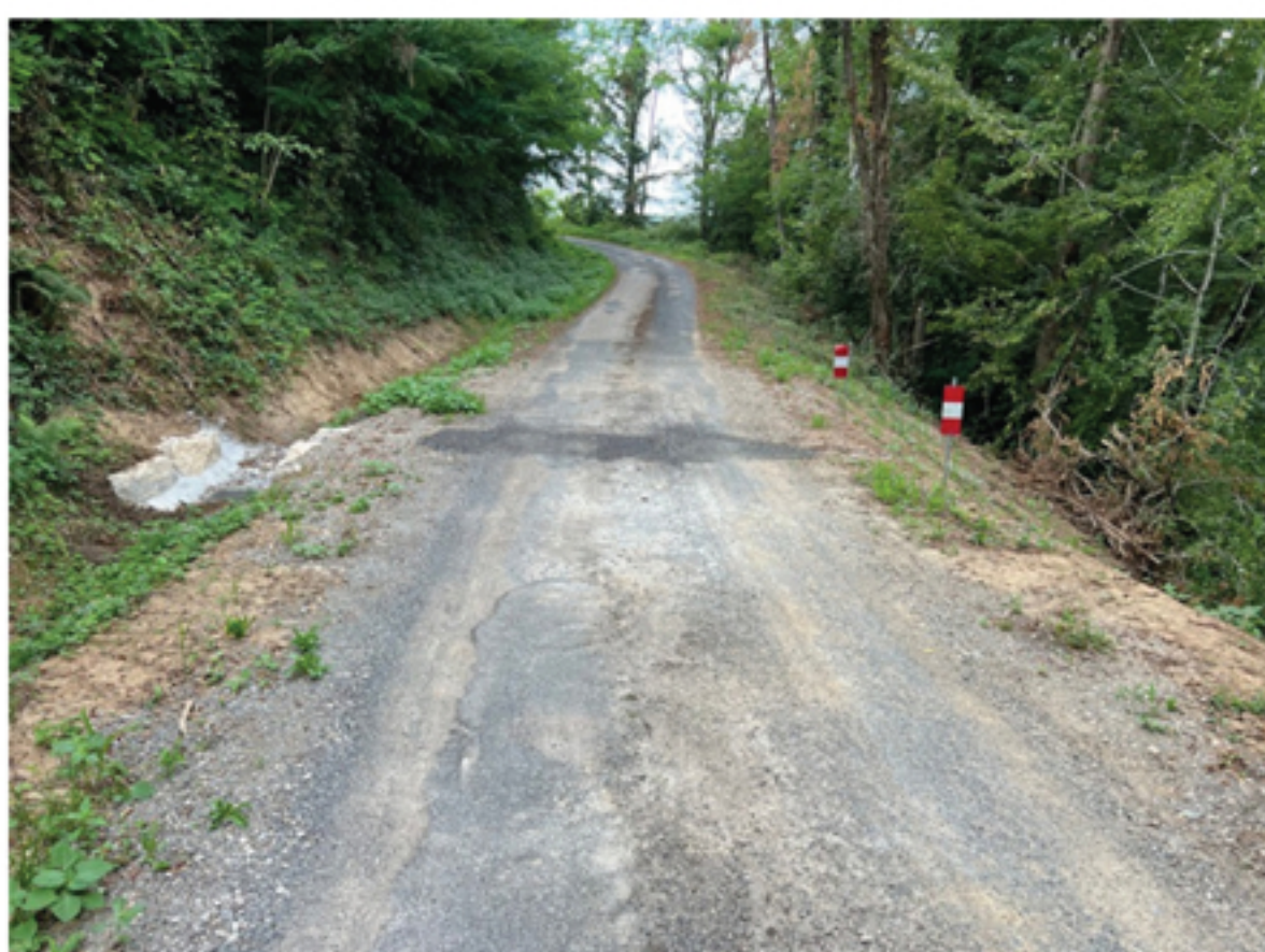
Aménagement route de Reyjade