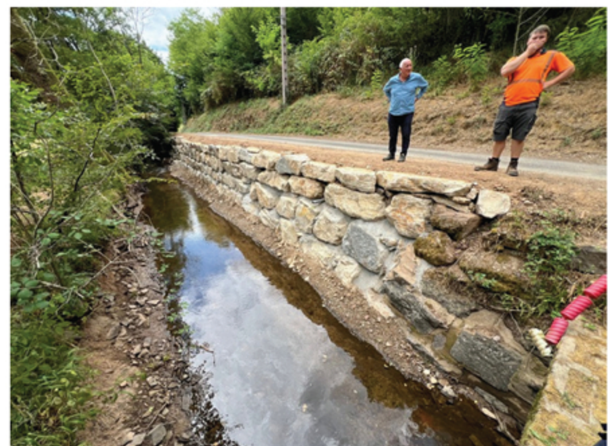
Enrochement impasse du Moulin du Sapinier