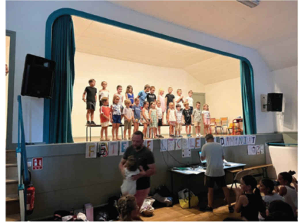
Les enfants nous ont offert un très beau spectacle pour clôturer l'année scolaire