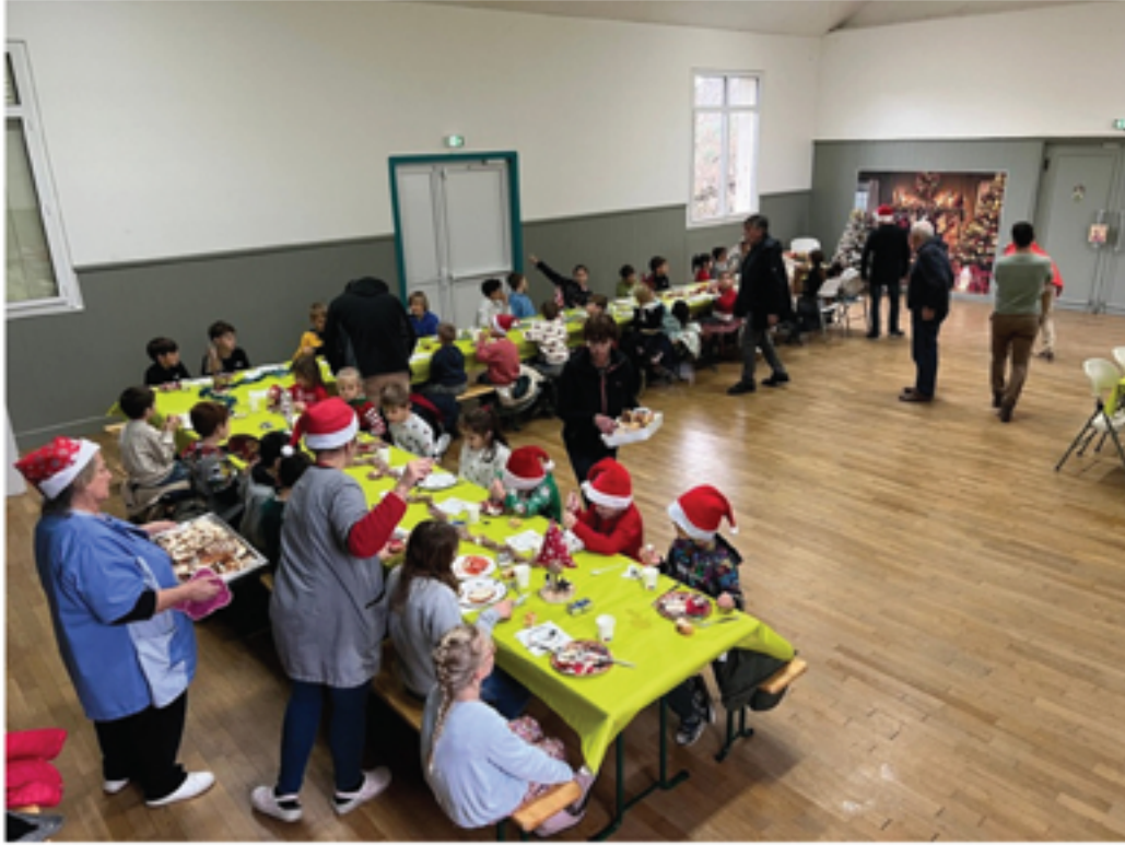
Joie et convivialité autour du traditionnel repas de Noël