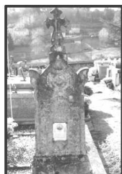
Tombe de Ambroise Arlebois