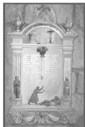
Tableau paroissial de 14-18, église

« L'idée est de donner sens à la lecture des noms du monument aux morts, à savoir être capable d'y associer une appartenance familiale, un domicile ou une simple anecdote de vie»; ce n'est en rien une recherche généalogique.