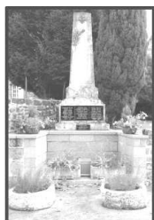
Monument aux morts 1923