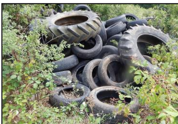
Dernière infraction constatée près de la Loyre